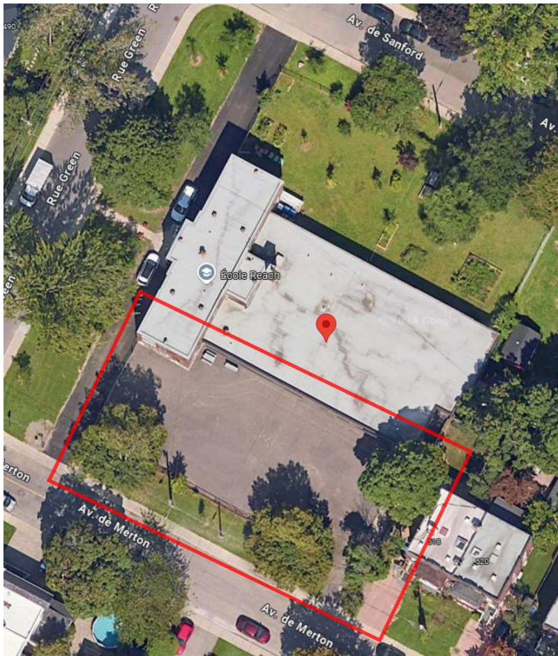
Cour avant secondaire sud (av de Merton)